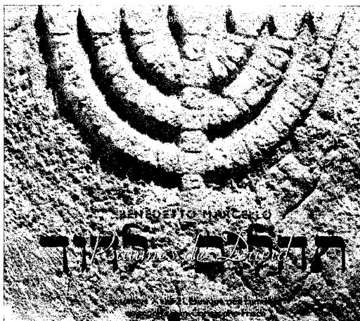
Benedetto Marcello, Psaumes de David (K. 617)

Temple du Foyer de l'Ame, 7 bis rue du Pasteur Wagner 75011 Paris, M° Bastille 17 h 30 , Entrée Libre.