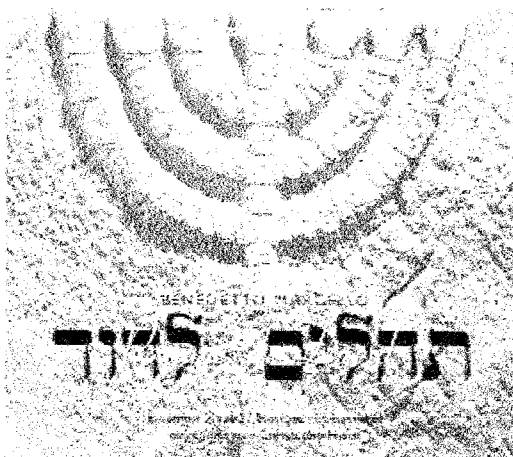
Benedetto Marcello, Psaumes de David (K. 617)

Temple du Foyer de l'Ame, 7 bis rue du Pasteur Wagner 75011 Paris, M° Bastille 17 h 30, Entrée Libre.